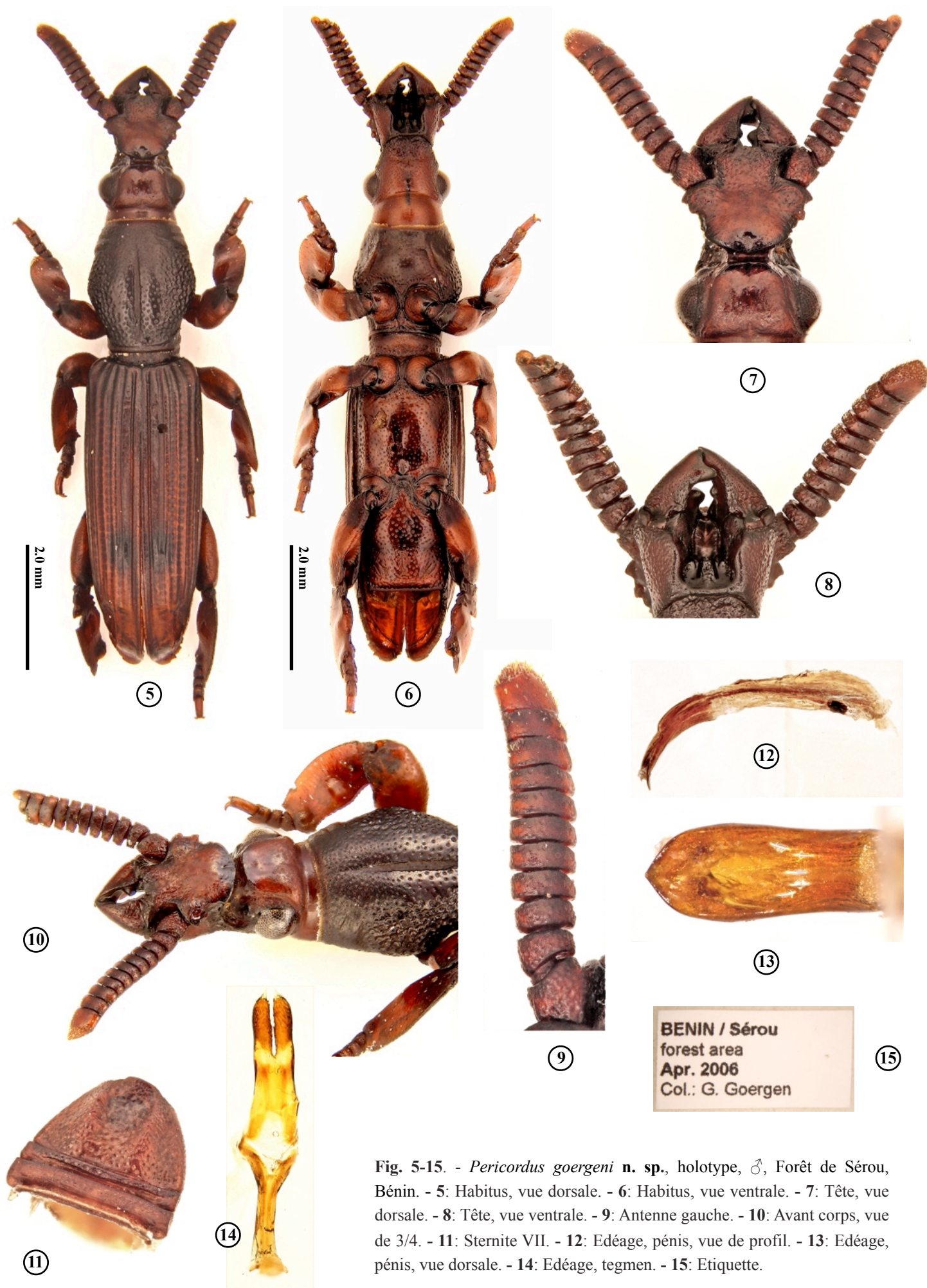
Fig. 5-15. - Pericordus goergeni n. sp., holotype, ♂, Forêt de Sérrou, Bénin. - 5: Habitus, vue dorsale. - 6: Habitus, vue ventrale. - 7: Tête, vue dorsale. - 8: Tête, vue ventrale. - 9: Antenne gauche. - 10: Avant corps, vue de 3/4. - 11: Sternite VII. - 12: Edéage, pénis, vue de profil. - 13: Edéage, pénis, vue dorsale. - 14: Edéage, tegmen. - 15: Etiquette.