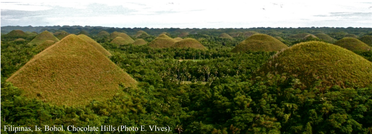
Filipinas, Is. Bohol. Chocolate Hills (Photo E. Vives).