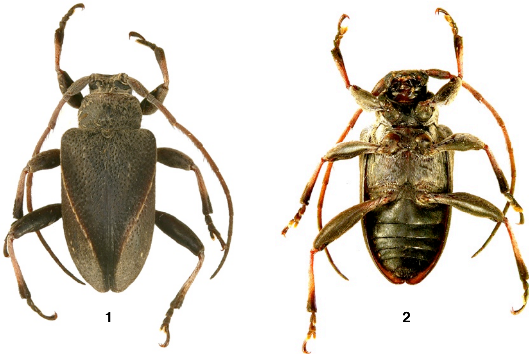
Fig. 1-2. Philippiniella drumontiana n. sp., holotipo. 1. Vision dorsal. 2. Vision ventral.