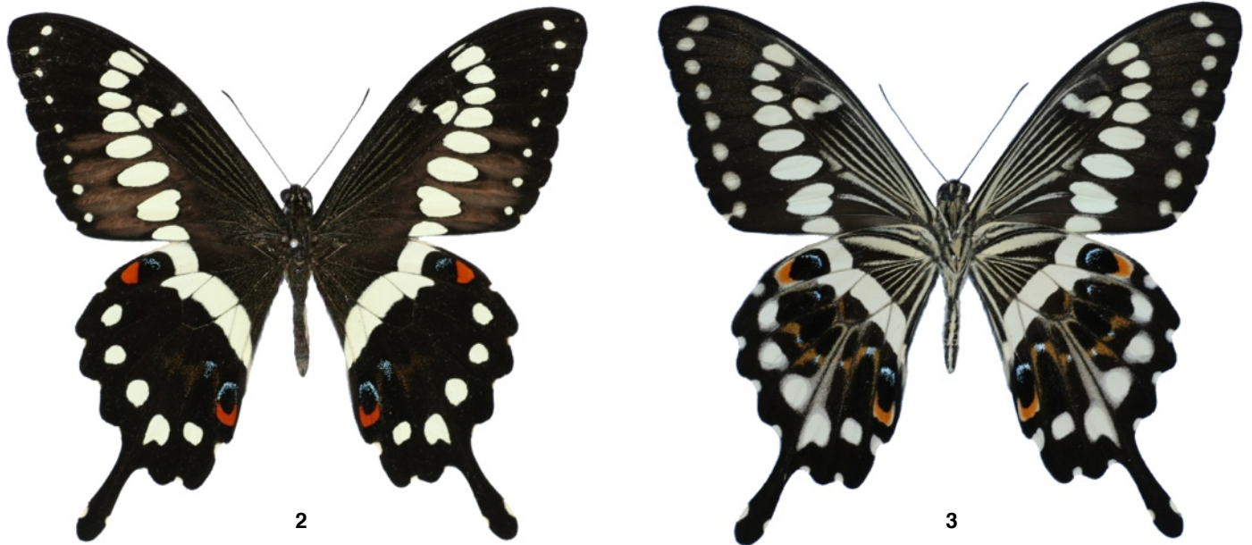
Fig. 2-3. Papilio menestheus Drury, 1773, ♂, Ghana, Ashanti region, Tano Offin Forest. 2) Recto. 3) Verso.