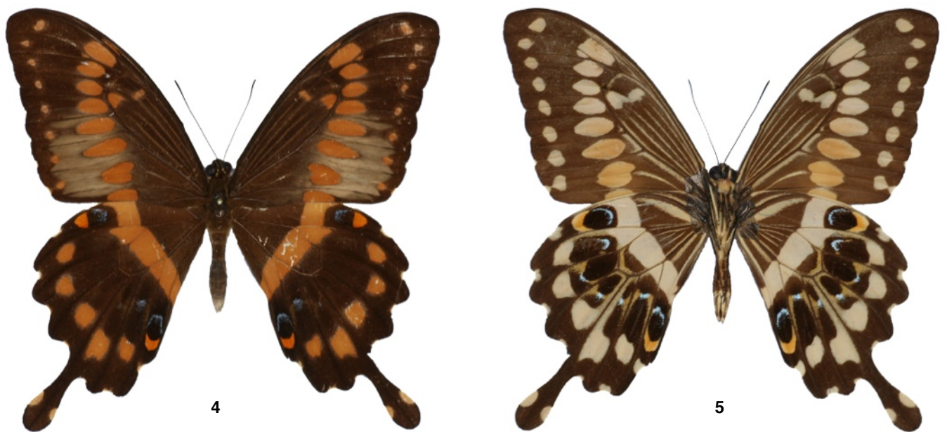
Fig. 4-5. Papilio menestheus Drury, 1773, forme marjorie , ♂, forêt du Banco, Côte d'Ivoire. 4) Recto. 5) Verso.