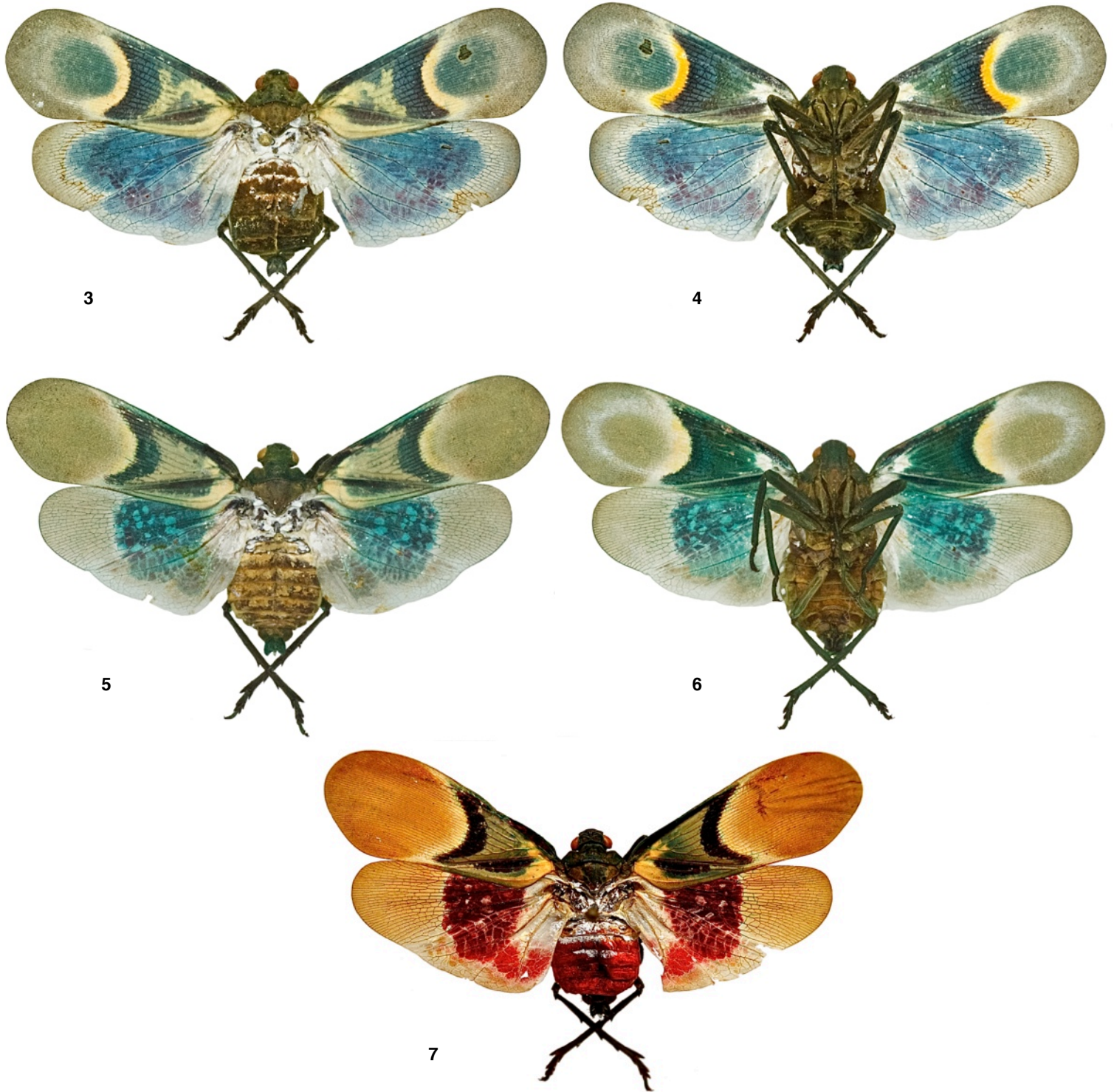
Fig. 3-7. - Scamandra , habitus. - 3 : S. pocerattui n. sp., paratype, ♀. - 4 : idem 3 , verso. - 5 : S. tamborana , ♀. - 6 : idem 5 , verso. - 7 : S. tamborana f. i. « melina », ♀, île de Florès (Indonésie).

Remerciements. – Nous remercions Alain Coache pour le détournage particulièrement réussi des cinq Scamandra .