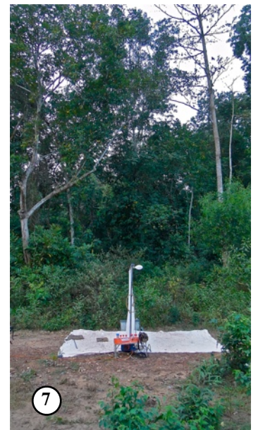
Fig. 4-7. - Forêt de Pahou, Ouidah, Bénin.

- 4: Forêt dense, biotope de Microplidus rainoni n. sp. - 5: Bernard Rainon (à gauche), Alain Coache (à droite) et Lou Gosse (au milieu).