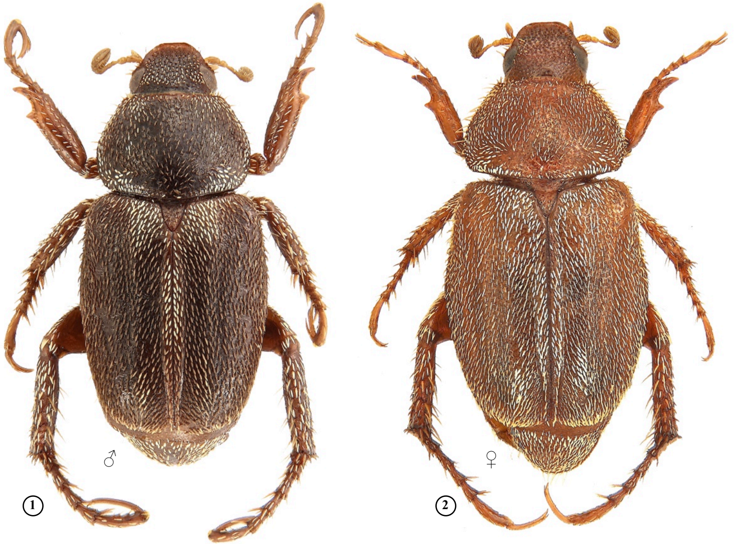
Fig. 1-2. - Habitus.

- 1: Microplidus rainoni n. sp., paratype ♂, forêt de Pahou, Ouidah, Bénin (In coll. Coache). - 2: Microplidus rainoni n. sp., paratype ♀, forêt de Pahou, Ouidah, Bénin (In coll. Coache).