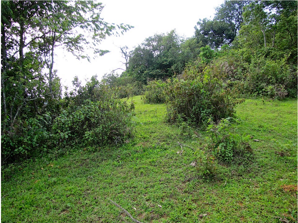
Fig. 9. - Biotope du Mt Pan (Laos).